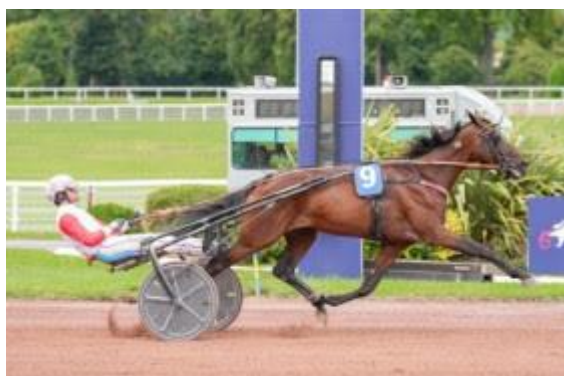
Falco Killer Gar