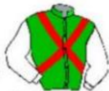
Cx de St André