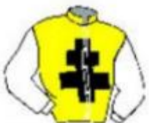
Cx de Lorraine