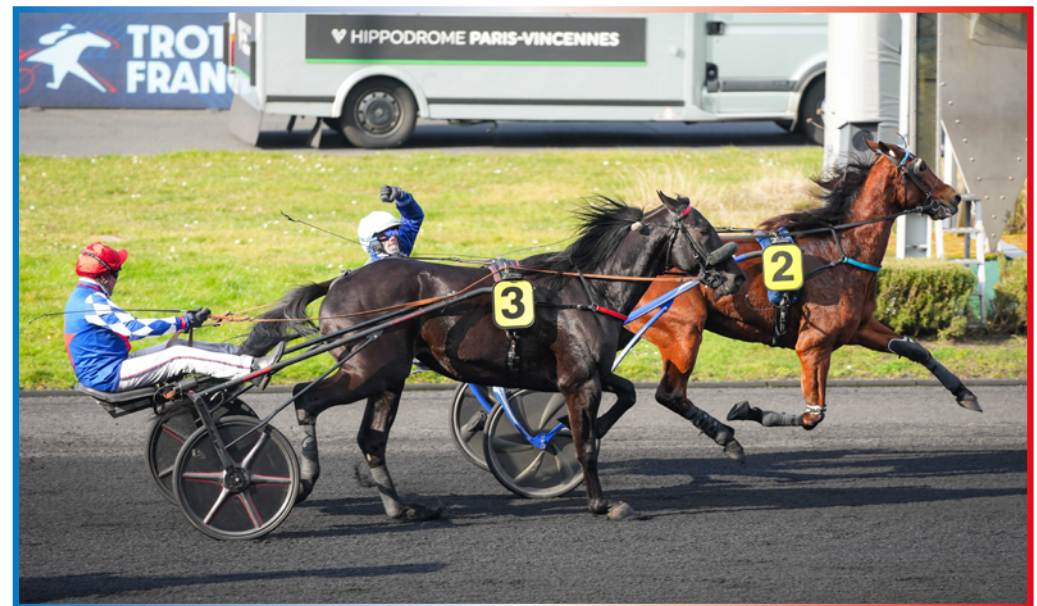
London et Light My Fire

Emmanuel Petit s'était immergé dans le monde des courses grâce à son rôle d'ambassadeur du Grand National du Trot lors de l'édition 2013. La star du football a franchi le pas en début d'année en enregistrant ses couleurs. Light My Fire pourrait lui apporter d'autres succès sur les hippodromes, et pourquoi pas un titre de Champion de France de Sulky ?