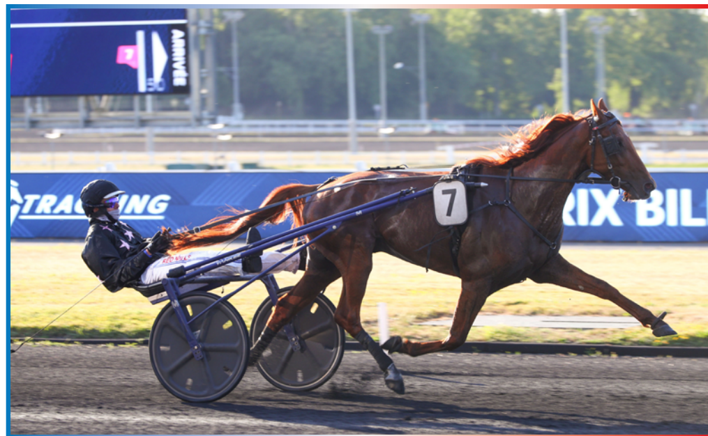
Louis Vitton Mijo